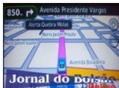
Reprodução da imagem obtida com o GPS Garmin